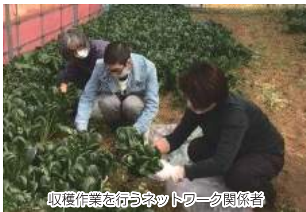
収穫作業を行うネットワーク関係者

この取り組みは、今年2月から「農産物直売所ふなっこ畑」出荷者の協力のもと、残ってしまった農産物を無償で同ネットワーク内の団体へ食材提供を行ったことをきっかけに、行われました。引き続き、生産者と共に継続的に実施してまいります。