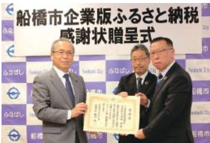
感謝状を持つ松戸市長(左)、大塚常務(中)、青木組合長(右)