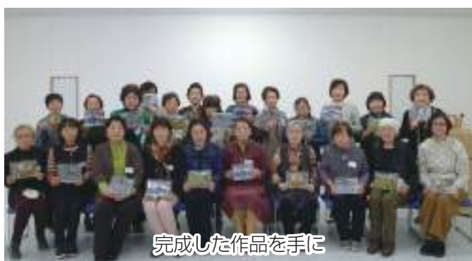
完成した作品を手に