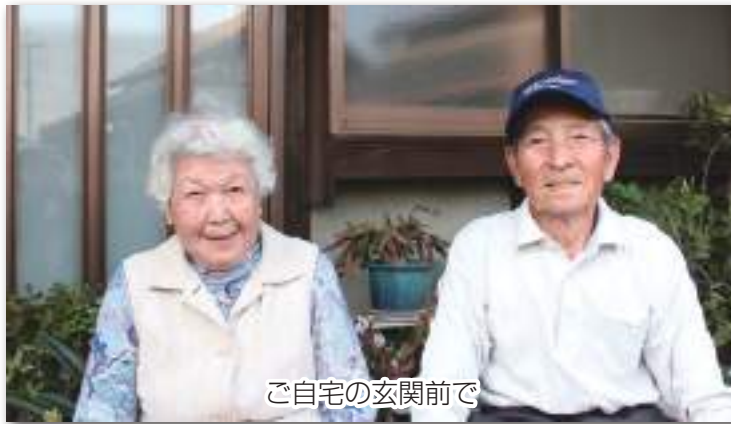
ご自宅の玄関前で